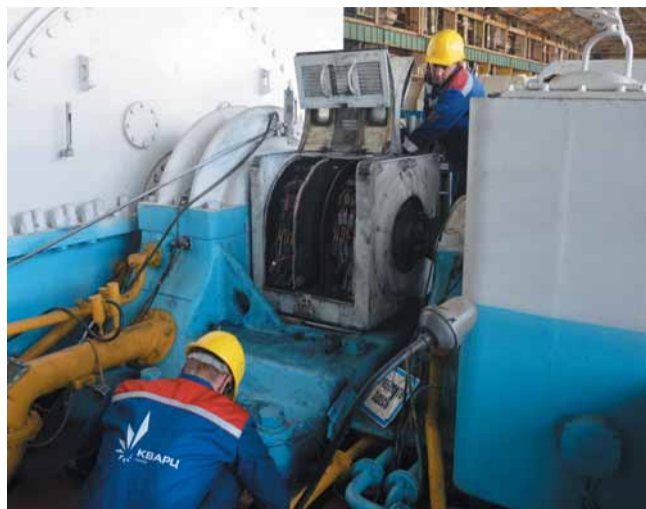
«Инженерный центр энергетики Урала» филиал УралВТИ. В кратчайшие сроки была разработана технология, предусматривающая несколько этапов: пошагово контролируемая выборка сетки трещин

Одним из наиболее значимых проектов этого года стал капитальный ремонт энергоблока ст. № 6 Ириклинской ГРЭС: большой объем типовых работ, запланированные сверхтиповые работы, плюс дополнительные коррективы как всегда внесли результаты дефектации оборудования. В ходе ремонта коллективом филиала были выполнены работы по замене сотовых надбандажных уплотнений ЦВД, смонтирован новый трубопровод острого пара в пределах котла, заменена конвективный пароперегреватель высокого давления, установлена модернизированная набивка на регенеративных воздухоподогревателях. После проведения дефектации и контроля с целью продления сроков эксплуатации оборудования, выявился значительный объем дополнительных работ. Так, при проведении контроля корпусов стопорных клапанов, было обнаружено растрескивание в районе паровпуска на одном из клапанов. Дефект был достаточно серьезный, после демонтажа пароподводящего гйба стало понятно, что трещина сквозная. Нашими специалистами совместно с Ириклинской ГРЭС было принято решение о привлечении к разработке технологической инструкции на ремонт клапана специализированной организации