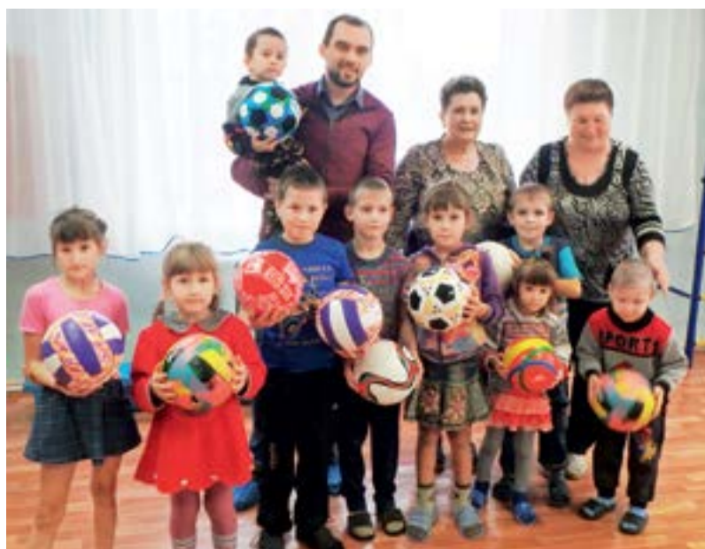
«КАТЭКЭнергоремонт» закупил спортивный инвентарь для Центра социальной помощи семье и детям «Шарыповский»

Также есть в городе Центр социальной помощи семье и детям «Шарыповский». Ни для кого не секрет, что малоподвижный образ жизни делает организм человека беззащитным для развития различных заболеваний. В социально-реабилитационное отделение Центра поступают дети в возрасте от 3 до 18 лет — и, чаще всего, эти дети из неблагополучных семей, они уже ослаблены и имеют нарушения здоровья. Различные физические нагрузки помогают восстановить детское здоровье. Центр испытывает постоянную нехватку спортивного инвентаря. Вот эту брешь филиал