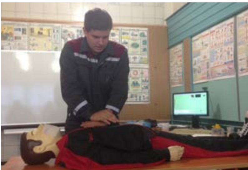
Конкурсное задание в Костромском филиале: оказание доврачебной помощи

Руководство компании благодарит участников и организаторов конкурсов «Лучший по профессии — 2017», поздравляет победителей. Проведение подобных профсоревнований мотивирует сотрудников на постижение секретов ремесла, повышение мастерства, апеллирует к честолюбию, амбициозности, гордости за свой труд и качество продукции, а в результате способствует повышению квалификации всего коллектива, стимулирует профессиональный рост и улучшение взаимоотношений, лояльность к бренду компании и её деятельности. Да и руководителю такие мероприятия помогают выявить лидера, обратить внимание на некоторых сотрудников, может быть, повысить зарплату, должность, расширить функционал... Такая традиция в энергетике была, есть и будет!