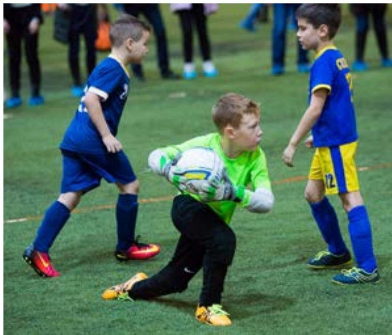
Юные футболисты из Сургута на международном турнире ФШ «Юниор» в Казани