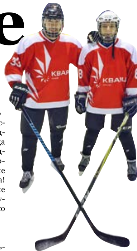
Хоккейная команда Уфимского филиала ООО «КВАРЦ Групп» существует два года

Два часа в неделю хоккейная коробка уфимского Дворца спорта принадлежит команде Уфимского филиала ООО «КВАРЦ Групп». До августа 2007 года уфимский Дворец