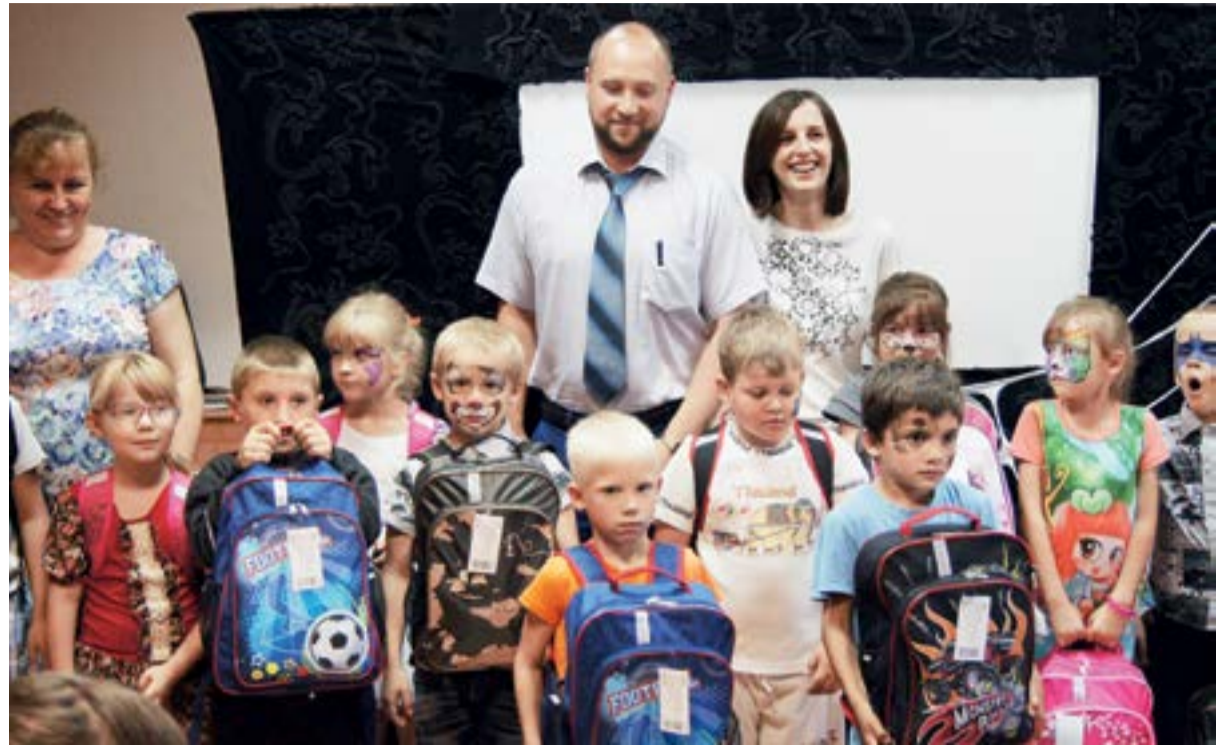
Активисты СРМ в Омске взяли шефство над детским домом

На протяжении 6 лет Омский филиал шефствует над Комплексным центром социального обслуживания населения «Бережок» Саргатского района и воспитанниками детского дома