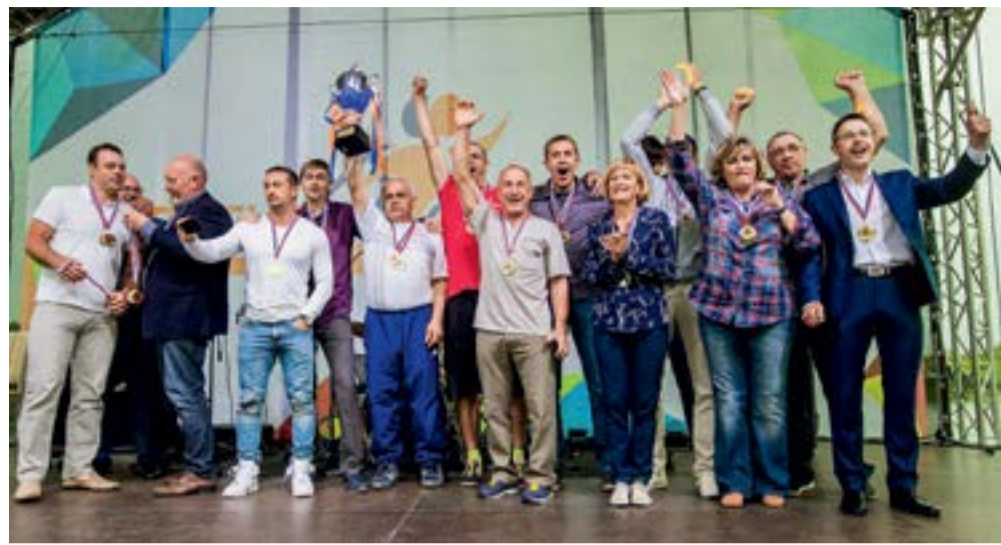
Команда «КВАРЦ Групп» — чемпион летней спартакиады

День второй ознаменовался завоеванием медалей в отжиманиях, индивидуальных беговых дисциплинах и гиревом спорте, а наши волейболисты, выиграв