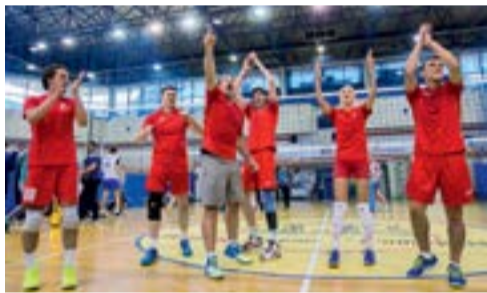
Победители в турнире по волейболу

Именно эти качества традиционно присущи коллективам «КВАРЦ Групп», поэтому для нашей команды, которая вот уже третий год выступает стабильным составом, необходимо было подтвердить свой высокий класс.